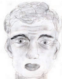
5 с. Турунтаево.