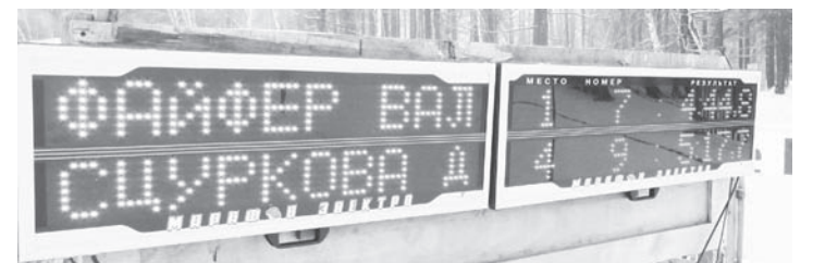
Табло системы «Лыжный стадион XXI века»

горе мало снега. Впрочем, плоский речной рельеф компенсировался замысловатыми зигзагами, которые выписывает наша река, и мастера от лыжников требуют не меньшего.